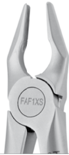
Zahnzange Apikal #1 OK Schneidezähne | FAF1XS