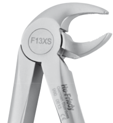
Zahnzange #13 UK Prämolaren | F13XS