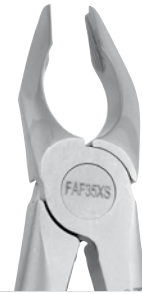
Zahnzange Apikal #35, OK Eckzähne u. Prämolaren | FAF35XS