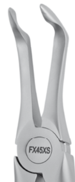
Zahnzange #45-SB UK Wurzel m. gezacktem Maul | FX45XS