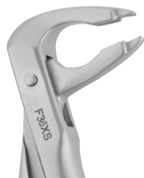
Zahnzange #36 UK Prämolaren | F36XS