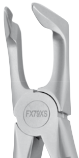
Zahnzange #79 UK Molaren (8er) | FX79XS