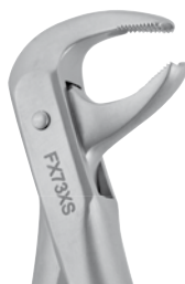
Zahnzange #73 UK Molaren | FX73XS