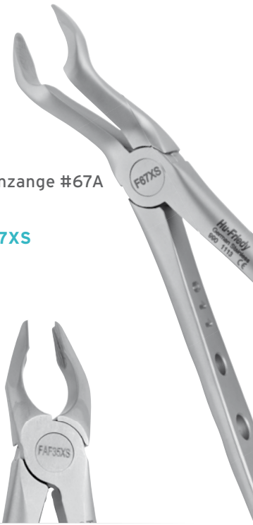
Zahnzange #67A OK | F67XS