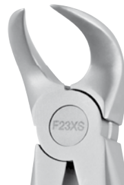
Zahnzange #23 Cowhorn UK Molaren | F23XS