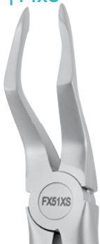
Zahnzange #51-SB, OK Wurzel, m. gezacktem Maul | FX51XS