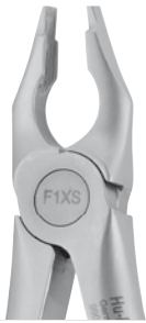
Zahnzange #34 OK Schneidezähne | F1XS