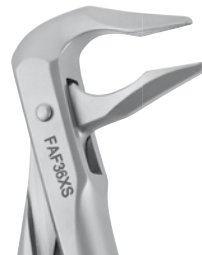
Zahnzange Apikal #36 UK Schneide- und Eckzähne, Prämolaren | FAF36XS